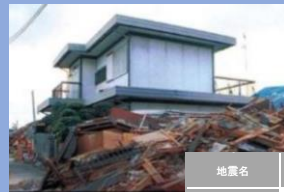
▲阪神・淡路大震災後の当社の住まい