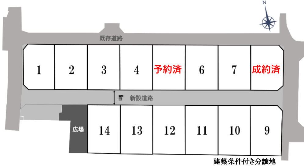
建築条件付き分譲地